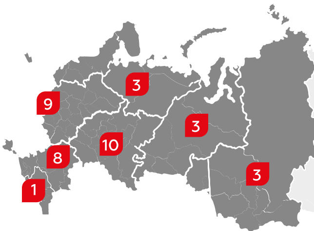
Количество РЦ Магнит